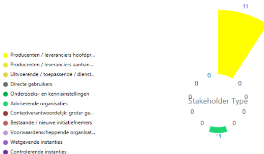
Machines voor de voedselindustrie - 341100

In het onderstaande figuur is visueel de mate van deelname van de verschillende stakeholder categorieën weergegeven.